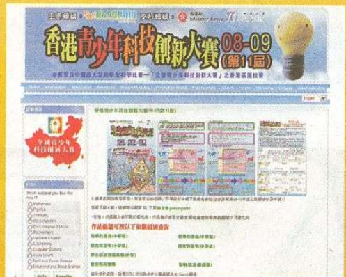
http://sic.newgen.org.hk/sic 2792 3639

大會為了令參賽的學校師生，能進一步了解賽事的內容，並分享上屆得獎作品，已特別製作宣傳展板，可借予學校作為展覽之用。有關詳情可瀏覽大會的網站或致電查詢。