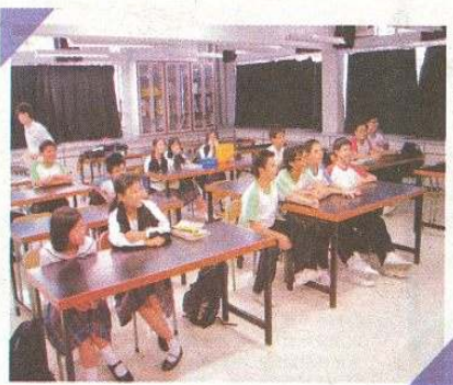
每年申請加入 TCTV 的同學，必須完成工作坊並達到一定成績，方可被取錄。