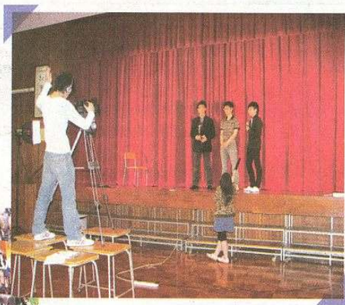
今年贏得資訊短片比賽的同學，其拍攝過程十分專業，劇本更經過數十次修改，最終成功摘下冠軍寶座。