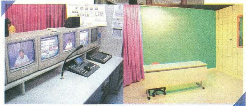
◎TCTV 擁有專業器材，包括能夠管理多條頻道的控制台。