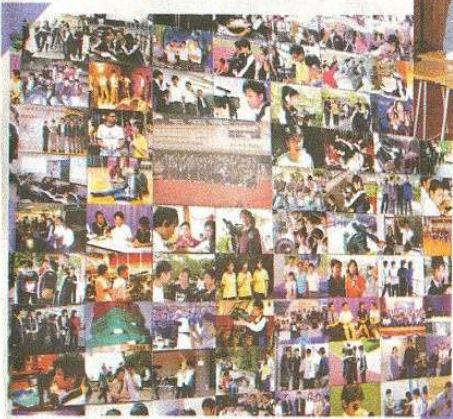
製作室的壁板，貼滿 TCTV 過去的拍攝花絮，段段珍貴的回憶全部呈現於記者眼前。