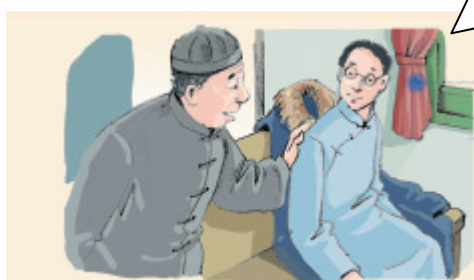
▲ 囑咐作者路上小心，夜裏要警醒些，不要受涼