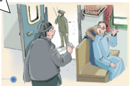
▲ 臨走時叫作者抵達後寫信給他