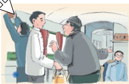
▲ 囑託茶房好好照應作者