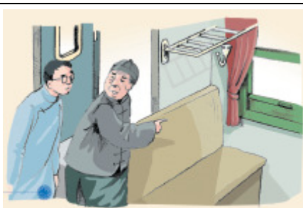
▲ 給作者揀定了靠車門的座位